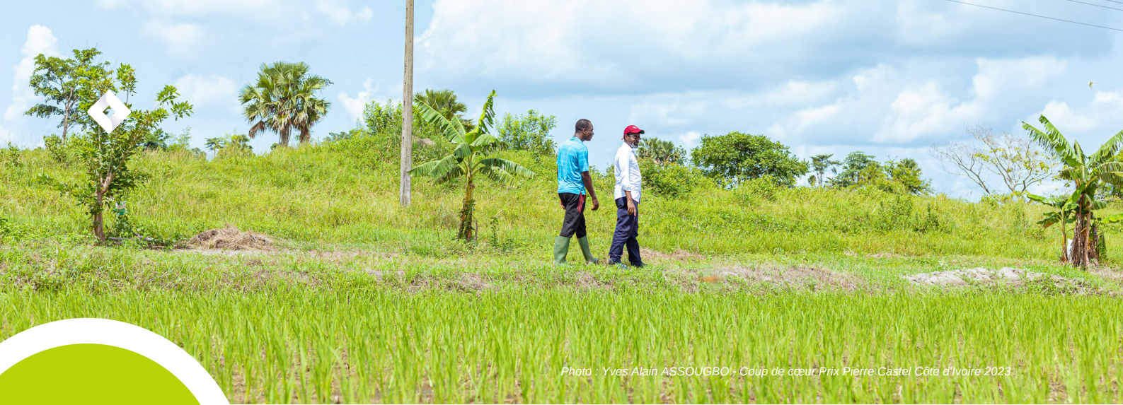
Coup de cœur Prix Pierre Castel Côte d'Ivoire 2023